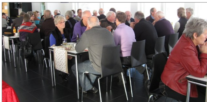
Der var stort fremmøde til årets generalforsamling / julefrokost - i alt 81 personer var tilmeldt.