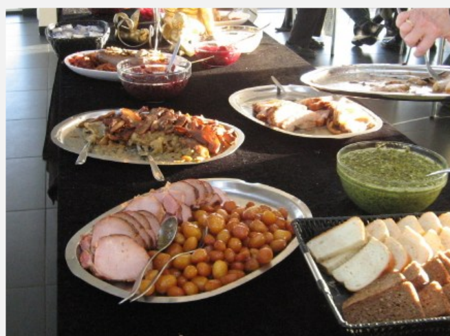
Mad i rigelige mængder - veltillavet som altid.